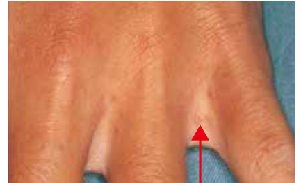
【大人の手(指間)】 疥癬トンネルを作り、卵を産みます