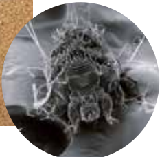
走査電子顕微鏡写真