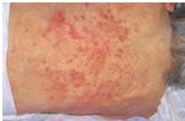
寝たきりの老人では背中に出ることもあります