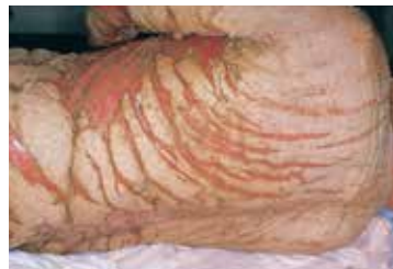
まれに重症化することがあります