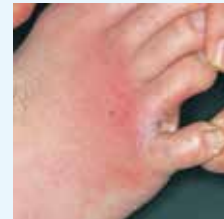
化膿菌がついた状態