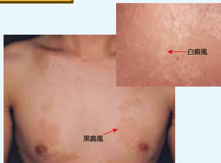
胸部、背部に好発します