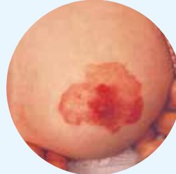
タムシに似ていますが皮膚癌です