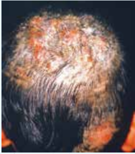
毛根まで及ぶと脱毛をおこします