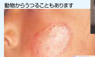
動物からうつることもあります