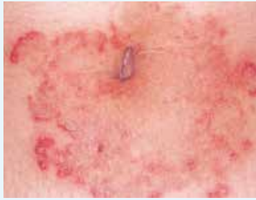
いわゆるタムシです