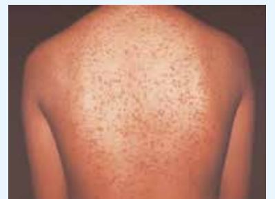
癬風菌によるニキビです