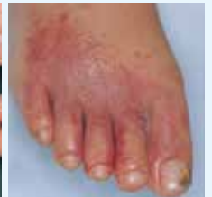
つけ薬などでかぶれることもあります